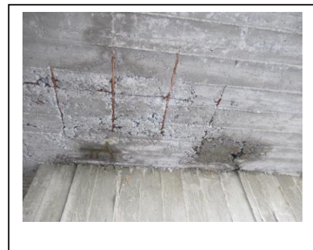
ברזל קרוב מדי לפני הקיר ולא מכוסה