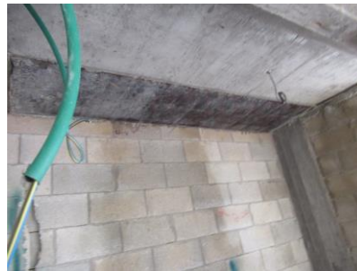
לא פורקו התבניות מהתקרה (נראים דיקטים)