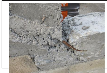
ברזל לא מכוסה בבניין