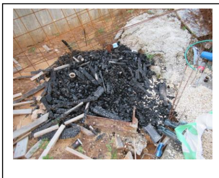
פסולת אחרי שריפה