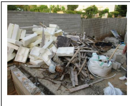
פסולת בניין שהושארה