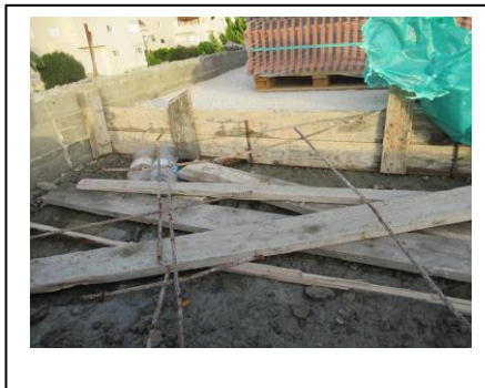
תבניות לא מפורקות