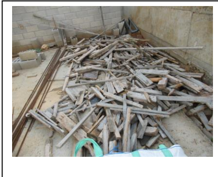
פסולת בניין שהושארה