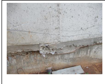
קיר חצר אחורית עם בטן