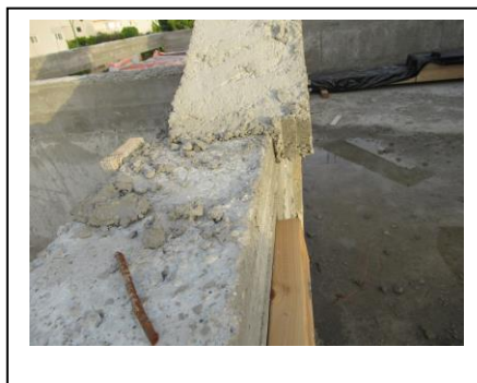
יציקה לא בקו ישר בקשת