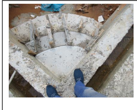
מדרגות בבריקה עקומות ולא לפי תכנית