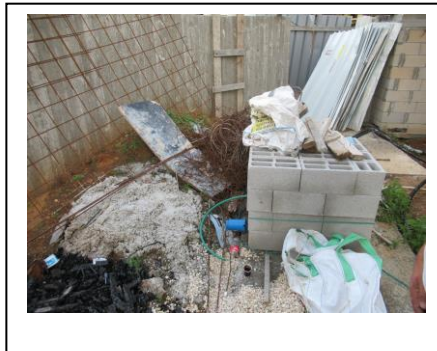
חומריי בניין ופסולת בניין שהושארו