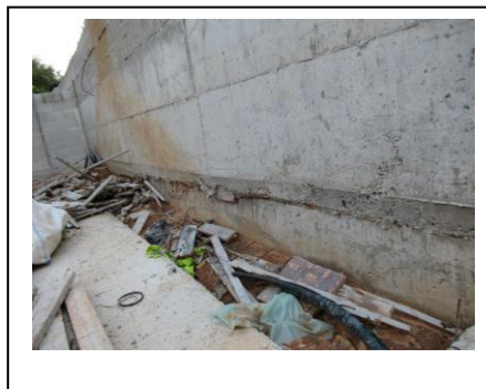
קיר חצר ברח ביציקה כולל פסולת בניין