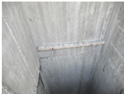
ברזלים לא נחתכו בפיר המעלית